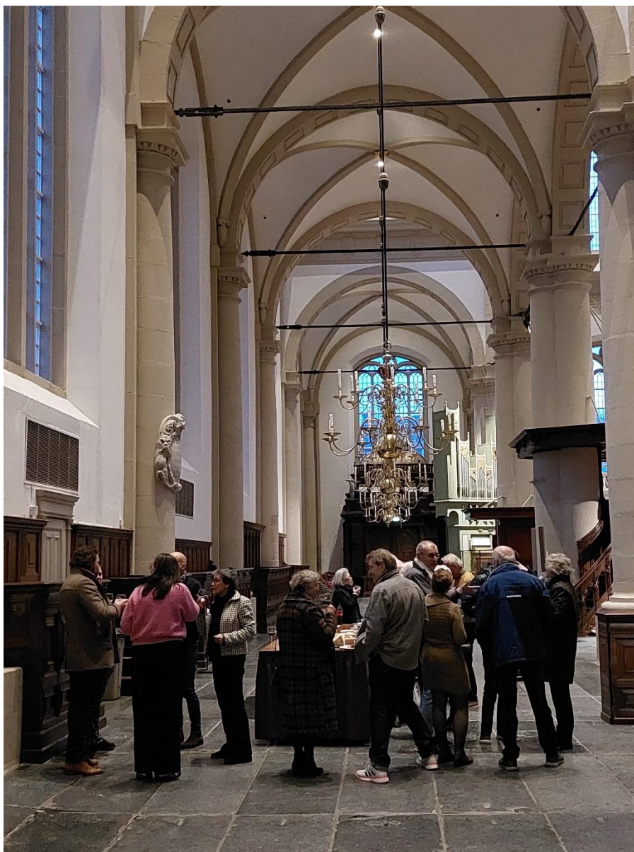
Afscheidsborrel oud kerkenraadsleden 23 februari 2024