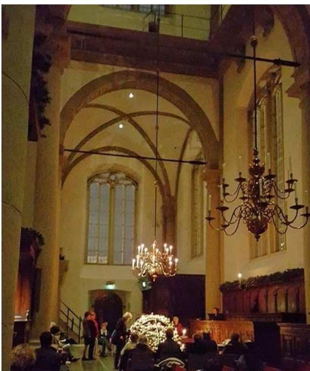
Een Braambosgebed in december 2014

De allereerste serie 'Braambosgebeden' was die in de Adventstijd 2013. Tien jaar geleden is dat nu. Ze zijn ons vertrouwd geworden: dat bijzondere half uur aan het eind van de vrijdagmiddag met die kenmerkende opeenvolging van orgelmuziek, lezingen, stilte, het aansteken van een kaars in het Brandend Braambos en een lied.