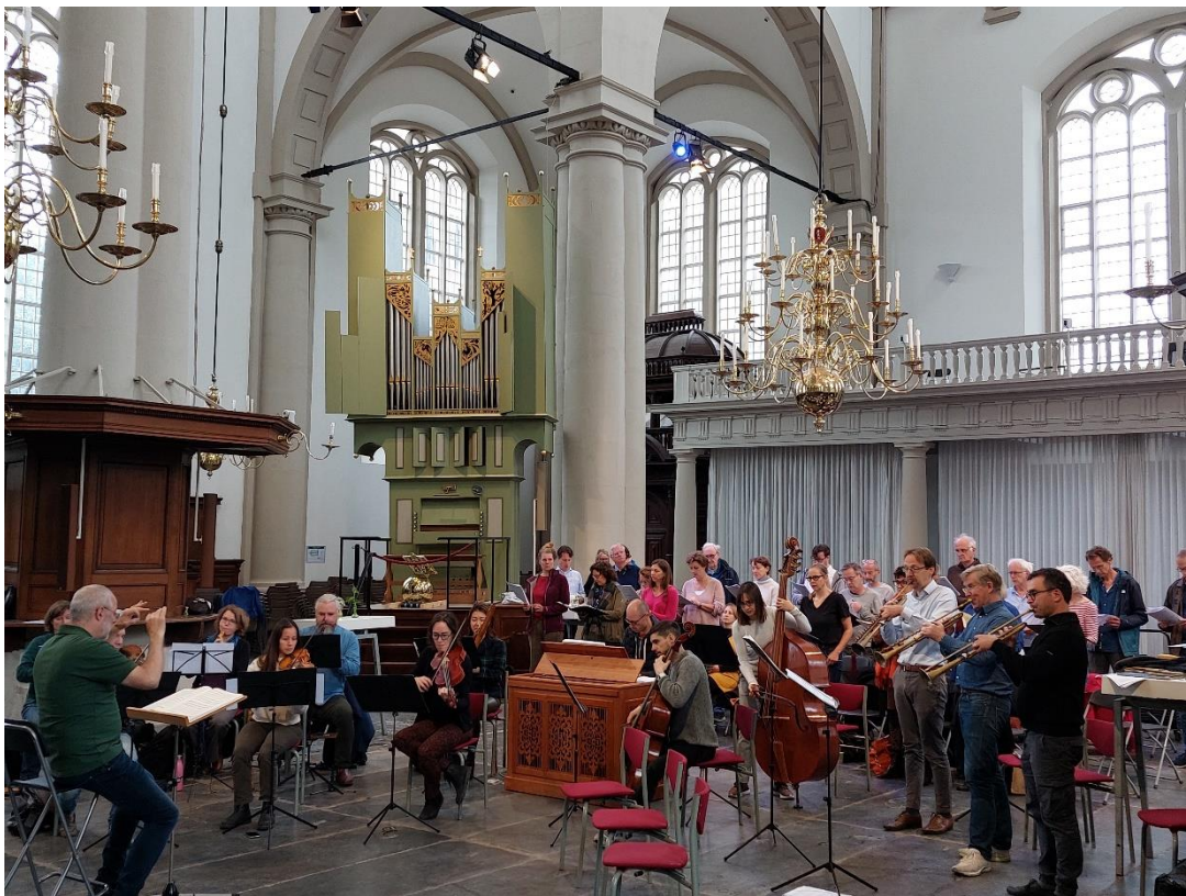
Repetitie Westerkerkkoor september 2022