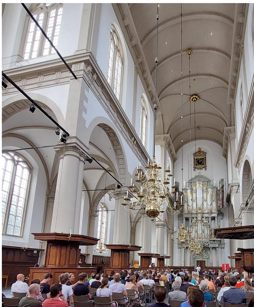
Een volle Westerkerk tijdens het winnaarsconcert van het Duyschot orgelconcours, 19 augustus 2023

Stichting Cantatediensten Westerkerk: NL 04 INGB 0003 8921 70